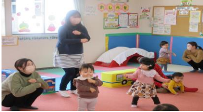
ぐるぐるぐる～。おててを回して、だんごむし体操！