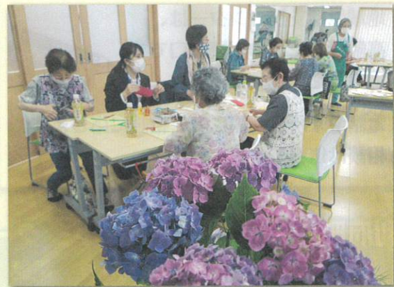
「つながり合い」や「見守り合い」の関係を醸成する機会となっています。