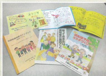
いろいろな認知症の資料を ご用意しています。