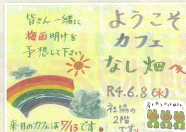
手作りのしおりを準備して お待ちしております。

地域包括支援センターは、 高齢者のための相談窓口です。 お気軽にご相談ください。 電話や来所、訪問にてご相談に応じます。 相談は無料です。