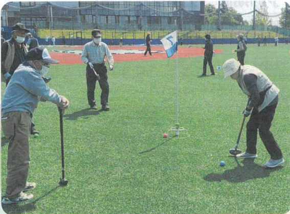
「第56回グラウンド・ゴルフ大会」の様子です。感染症対策として、午前と午後の2部制で行いました。