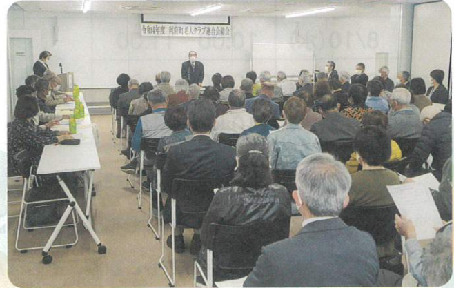
「令和4年度総会」は、コロナ禍の影響もあり3年ぶりの開催となりました。