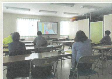
認知症に関する動画鑑賞。 新たな気づきが見つかります。