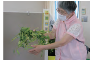
やさしい・やさい