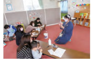
ゆるっとナチュラル育児の会