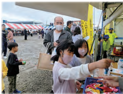
令和 5 年 10 月 9 日(月) 十符の里—ALL RIFU 産業祭