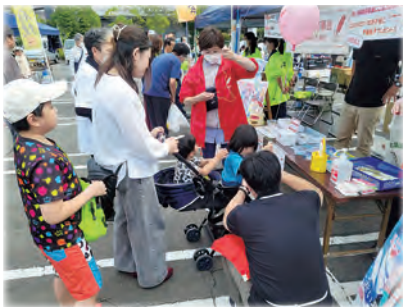
令和 5 年 10 月 1 日(日) 2023 利府梨まつり