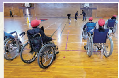
令和5年11月17日(金) しらかし台小学校にて(3学年、4学年)