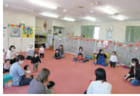
ピアノ&リトミック