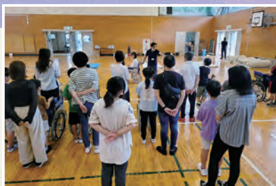
令和5年9月8日(金) 青山小学校にて(3学年PTA主催)