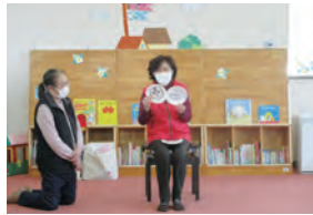
ドリーム・エル りふ