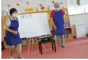
おはなしばんどら

十符っ子広場で支援活動をしているサークルを紹介します。ここで紹介する子育て支援サークルは、利府町に登録している団体で、子育て経験者や子育て支援に係わるボランティアにより、乳幼児を子育てしている家庭へのさまざまな支援活動を行っています。毎月、サークルによるお楽しみ会を開催していますので、ぜひ参加してみてください。スタッフ一同、お待ちしております。