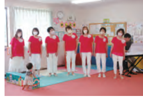
ウォールナッツハーモニー