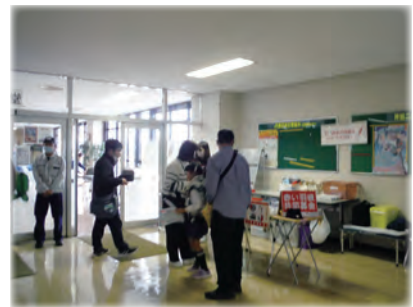
令和 5 年 10 月 21 日(土) 第 35 回新幹線車両基地まつり