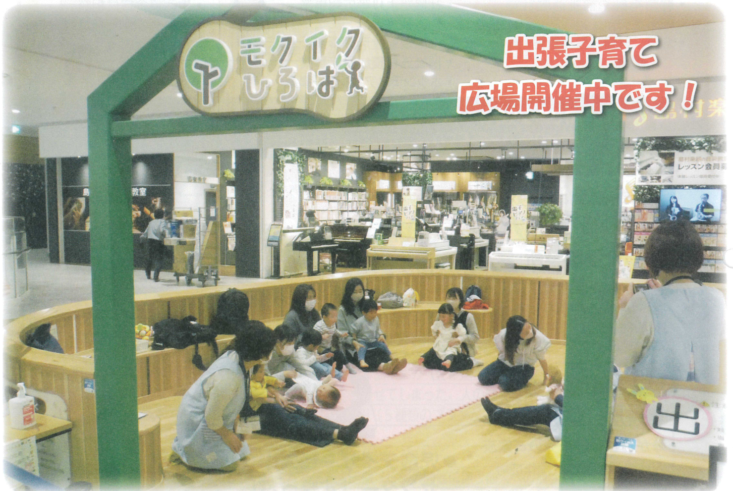
イオンモール新利府南館3階「モクイクひろば」に保育士が出張しています！（関連6頁）