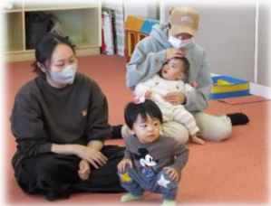
おみやげは、折り紙のこまです。