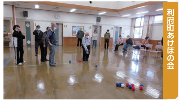
利府町あけぼの会