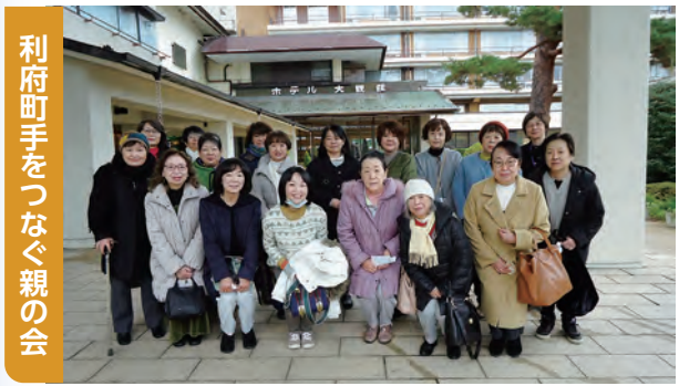
利府町手をつなぐ親の会