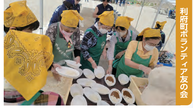
利府町ボランティア友の会