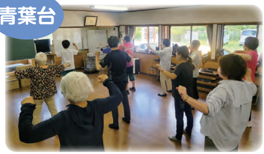
活用できる地域資源の相談をお受けします