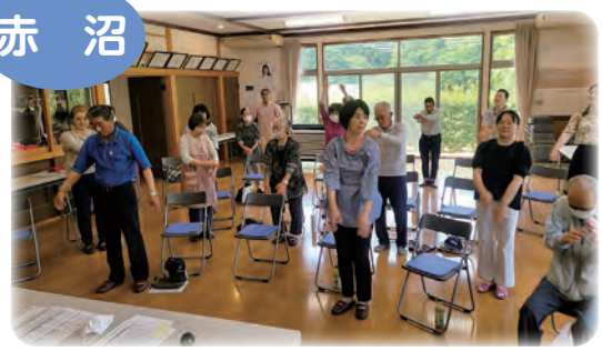
地域ネットワークづくりのお手伝いをします