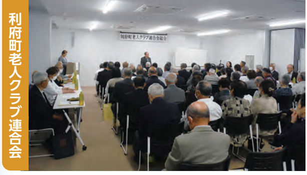
利府町老人クラブ連合会

本会で事務局を担っている福祉団体の活動を紹介します。活動に興味のある方は下記までご相談ください。