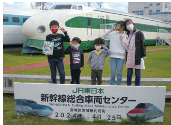
JR東日本 新幹線総合車両センター見学の様子

これまでご利用いただきましたご利用者 様及びご家族様等には感謝申し上げますと ともに、引き続き本会の児童福祉事業にご 理解とご協力をお願いいたします。