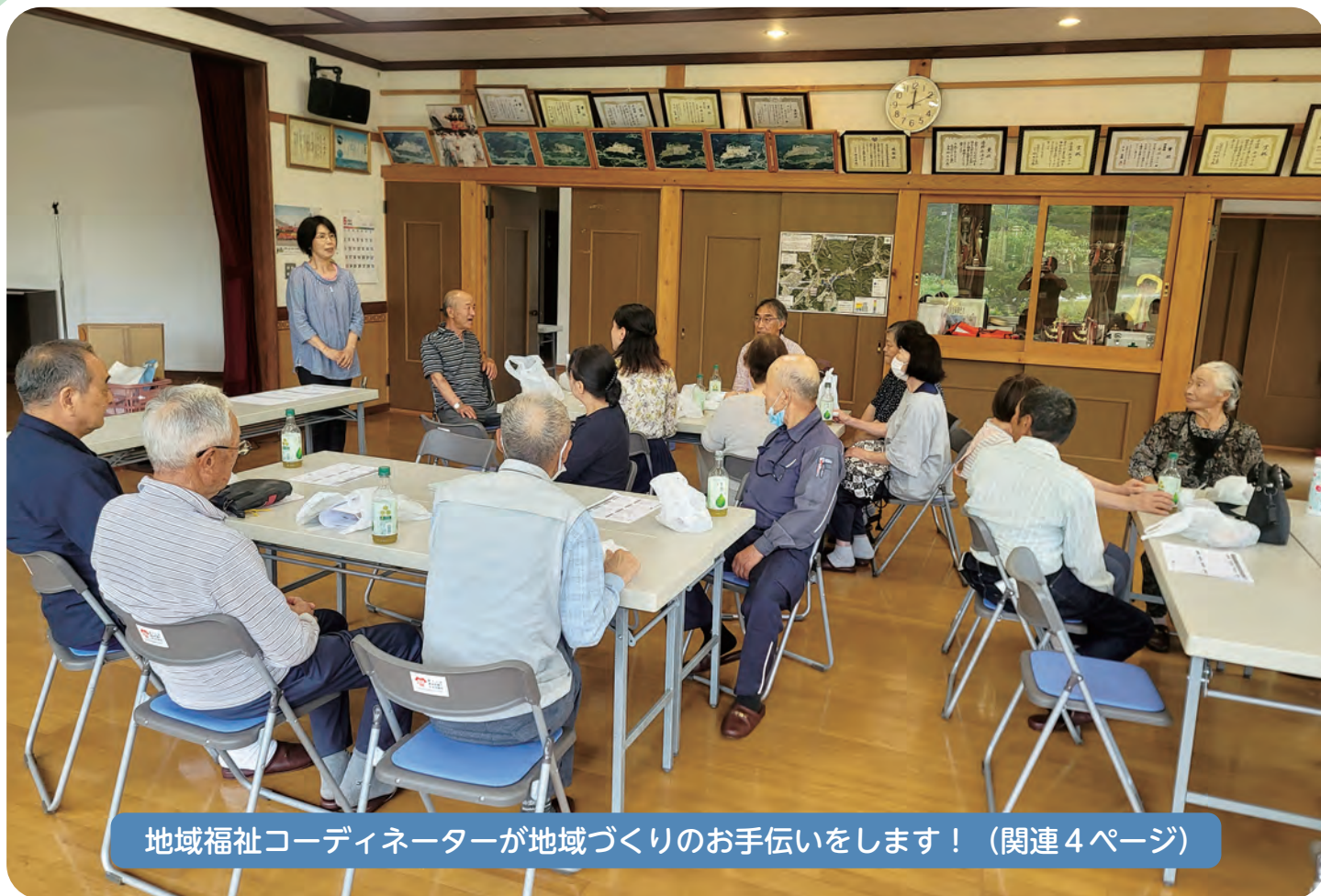
地域福祉コーディネーターが地域づくりのお手伝いをします！（関連4ページ）

利府町社会福祉協議会は、法人の認可を取得した福祉団体であり、皆様の会費等によって運営されています。