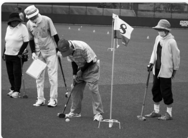
R2.9月に利府町野球場にてグラウンド・ゴルフ大会を行いました。

いくつになっても明るく楽しく元気よく生活するために、グラウンド・ゴルフなどの健康維持活動や、集会所を利用したお茶会、地域の公園清掃活動など、様々な活動を通し会員同士の親睦と交流を深めながら活動を行っています。