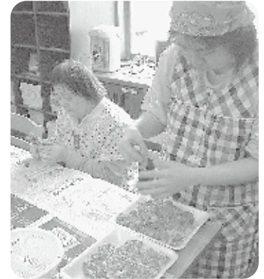
「芋煮会」などの楽しいイベントも開催