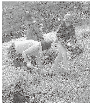
奉仕活動(除草)にも取り組んでいます

保護者やご家族、そして活動にご理解を頂ける方々のご入会を随時受け付けております。一人でも多くの方のご入会をお待ちしております。