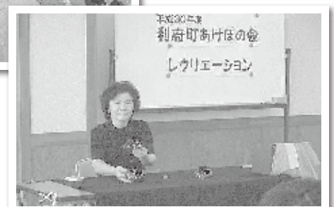
レクリエーション 「マジックショー」 (利府町保健福祉センター)

【お問い合わせ先】 利府町社会福祉協議会 利府町障害者地域活動支援センター TEL:022-354-1556