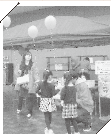
第12回 利府梨まつり (9月30日)

皆様からお寄せいただいた募金は、宮城県内の地域福祉事業に活用される他、災害準備金として役立てられます。