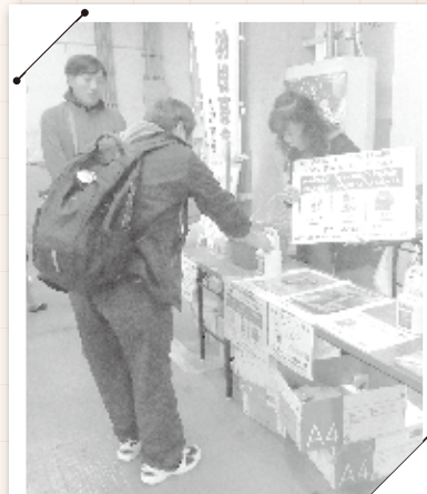
第33回 新幹線車両基地祭り(10月27日)