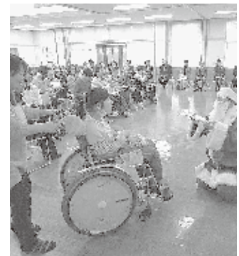
親子参加でクリスマス会

お問い合わせ先／利府町社会福祉協議会 利府町障害者地域活動支援センター Tel:022-354-1556