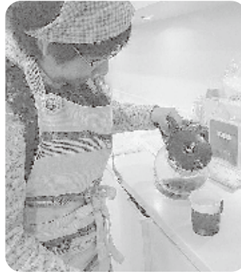
地域活動支援センターの、ボランティアさんも募集中

お問い合わせ先 利府町障害者地域活動支援センター Tel:022-354-1556