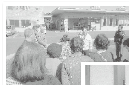
移動研修会「施設見学」 (松の実福祉会 松の実)

同じ悩みをもち、誰にも相談できずに孤立しているご家族に対し、同じ立場の家族と共に考えてみましょう。