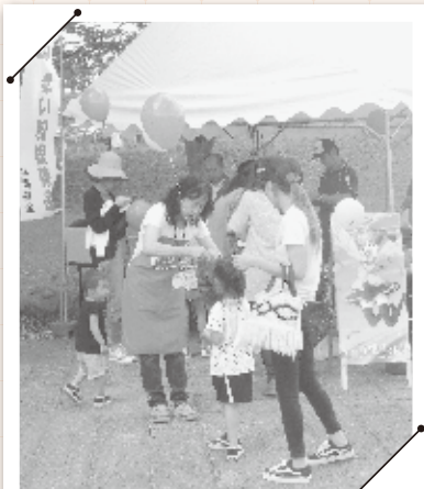
第28回「十符の里-利府」フェスティバル (10月7日)